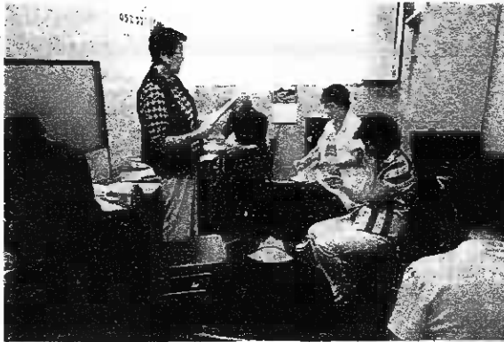
始まる前のミーティング 廊下にはマスクミが待機中