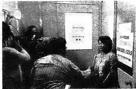
NHKのインタビュー 電話番号が写るようにポスターの前でコメント